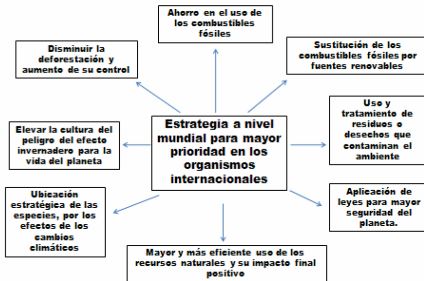
Figura 1 Estrategia mundial para mayor prioridad