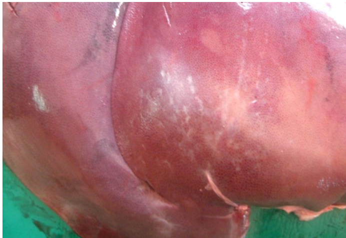
Fig. 1 Hígado con “manchas de leche” por migración parasitaria