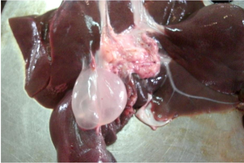
Fig. 2. Cisticercosis parasitaria en hígado